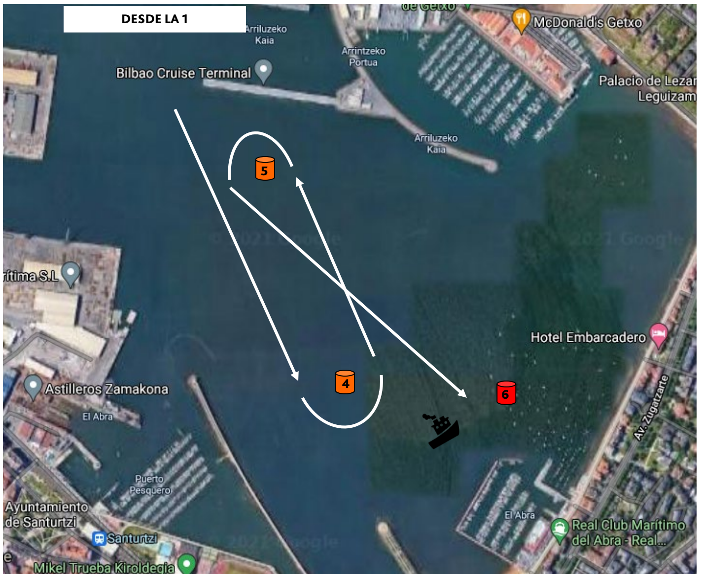
Gráfico Recorrido Abra Interior