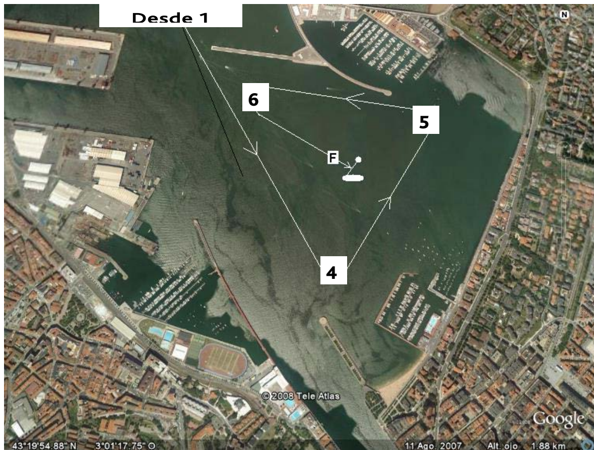
Gráfico Recorrido Abra Interior