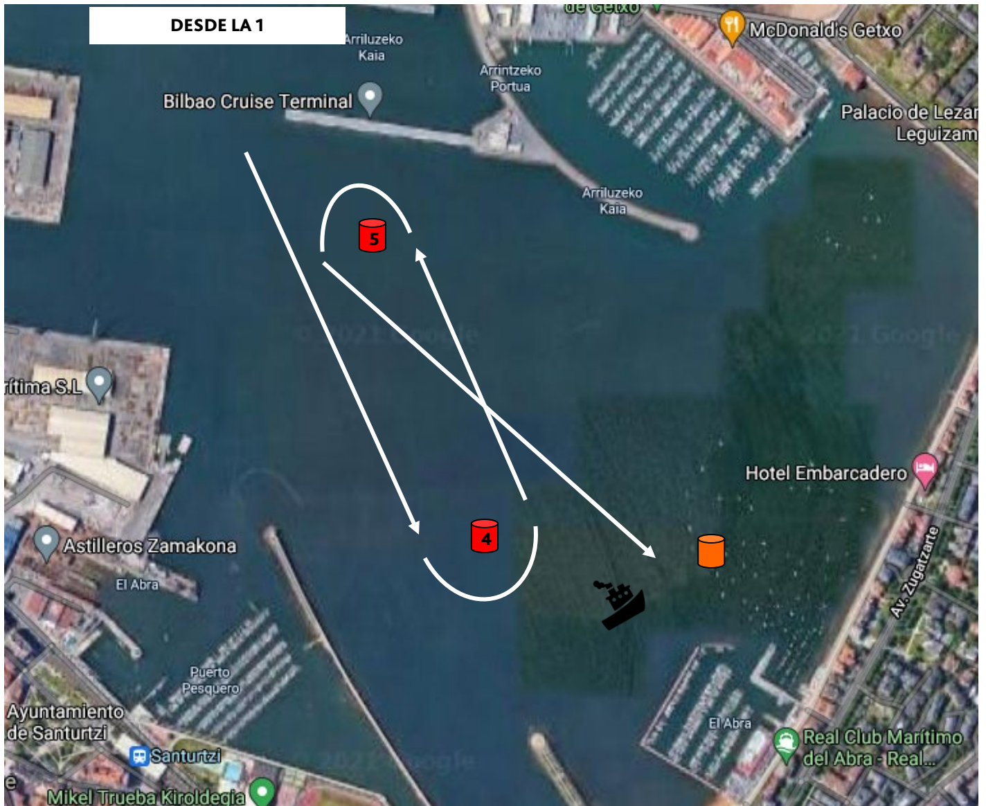
Gráfico Recorrido Abra Interior